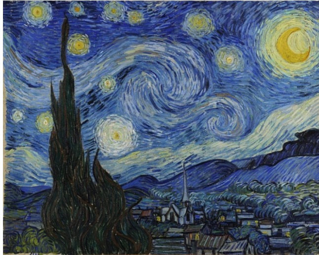
VAN GOGH, La notte stellata